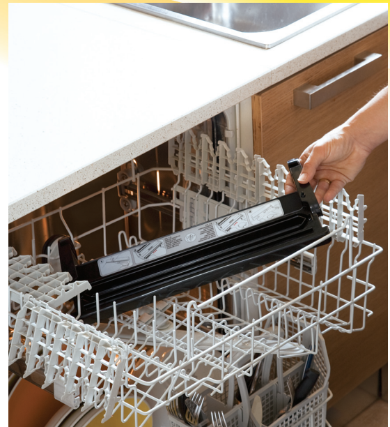
Vaschetta lavabile in lavastoviglie Tray washable in dishwasher